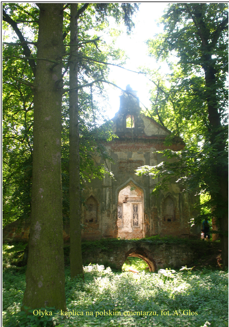
Ołyka – kaplica na polskim cmentarzu