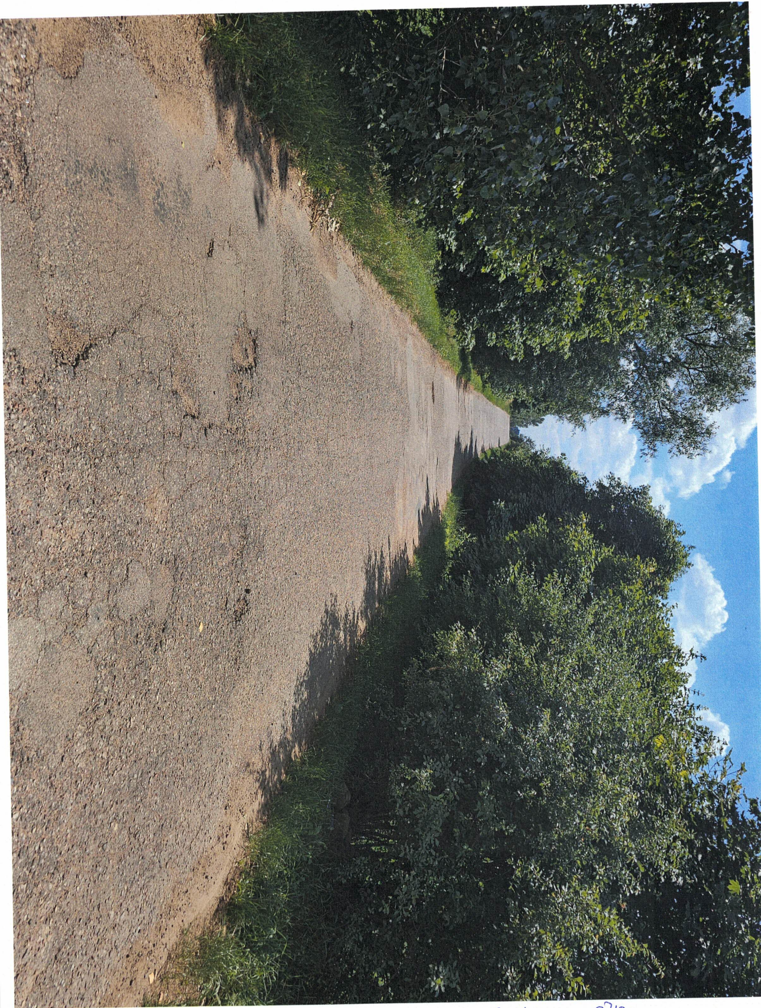
SAKAPAMUK NR 3