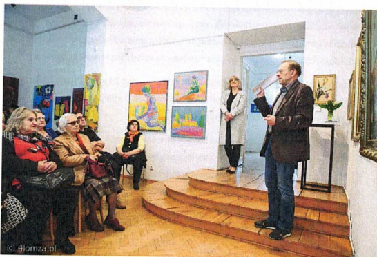
Fotografia 13. Oddział Regionalny Towarzystwa Uniwersytetów Ludowych w Łomży w zadaniu "Złoty wiek - ciekawy i radosny"; Wykład "Jerzy Wit Majewski - opowieść o malarzu z rodowodem łomżyńskim"; 17 maja 2023 r., Łomża