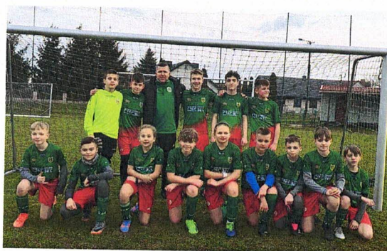
Fotografia 4. Klub Sportowy Śniadowo; młodzi piłkarze KSS podczas zawodów; 7 kwietnia 2023 r., Śniadowo

Celem działania Organizacji było rozwijanie ogólnej sprawności fizycznej wśród dzieci i młodzieży Gminy Śniadowo poprzez treningi piłki nożnej, a także popularyzacja aktywności ruchowej, jako alternatywy dla biernych form spędzania wolnego czasu. Skupiono się na nauce pracy zespołowej, świadomości na temat zasad fair-play, propagowaniu zdrowego stylu życia, czy wyluskiwaniu szczególnie utalentowanych piłkarzy i pomoc w pokierowaniu ich dalszą karierą. W projekcie KSS wzięło udział co najmniej 60 osób, uczestnicząc w regularnych treningach piłkarskich oraz biorąc udział w zawodach realizowanych przez Podlaski Związek Piłki Nożnej, czy zaprzyjaźnione MOSiRy w Łomży, Piąticy i Ostrołęce.