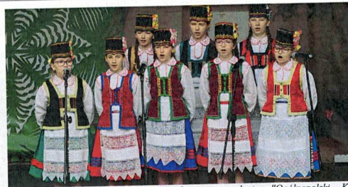
Fotografia 7. Fundacja Sztuki i Dialogu w zadaniu "Ogólnopolski Konkurs Zespołów Kurpiowskich 2023"; Zespół podczas występu; 18 czerwca 2023 r., Nowogród