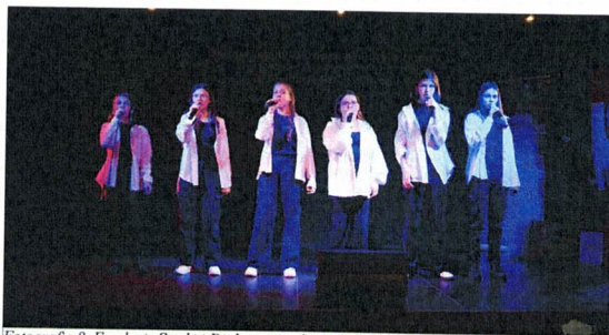
Fotografia 8. Fundację Sztuki i Dialogu w zadaniu "Piosenka jest dobra na wszystko - X Cykl Festiwalu Tematycznych"; Zespół podczas konkursu "XXXI Gielda Piosenki Dziecięcej i Młodzieżowej" w Łomży; 18 listopada 2023 r., Łomża