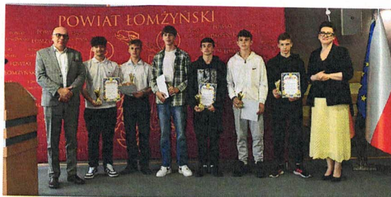
Fotografia 3. Powiatowy Szkolny Związek Sportowy w Łomży, Podsumowanie osiągnięć sportowych uczniów za rok szkolny 2022/2023; 16 czerwca 2023 r., Łomża