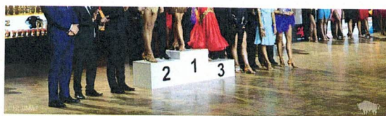
Fotografia 15. XXVII Ogólnopolskiego Turnieju Tańca Towarzystkiego; Patronat Honorowy Starosty Łomżyńskiego; 26 listopada 2023 r., Piątnica