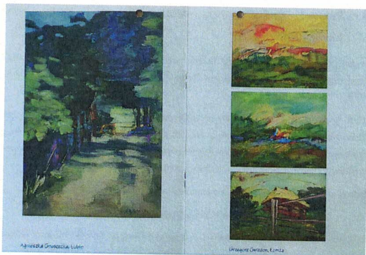
Fotografia 14. Fundacja Sztuki i Dialogu w zadaniu "Plener Malarski - kultura łomżyńska pędzlem malowana (IX edycja)"; folder z pracami wykonanymi przez uczestników wydarzenia