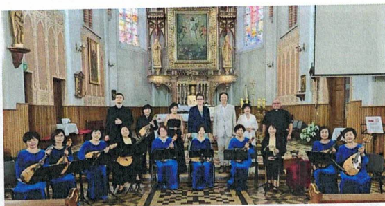
Fotografia 11. Fundacja Muzyczna "Ostinato" z siedzibą w Czartotii w zadaniu "Koncert Muzyki Klasycznej zorganizowany w ramach XIX Międzynarodowego Festiwalu Kameralistyki "Sacrum ET Musica", Benissimo Mandolin Orchestra; 3 września 2023 r., Piątnica