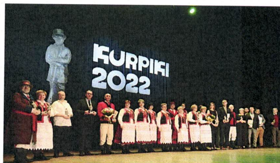
Fotografia 18. KURPIKI 2022. Takie są Kurpie!; Patronat Honorowy Starosty Łomżyńskiego; 20 marca 2023 r., Ostrołęka