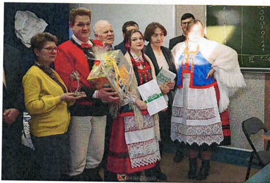
Fotografia 9. Związek Kurpiów w zadaniu "V Olimpiada Wiedzy o Kurpiach"; Laureaci Konkursu; 5 grudnia 2023 r., Ostrołęka

Misją Związku Kurpiów w tym zadaniu było podniesienie zainteresowania młodego pokolenia małą ojczyzną, jej historią, a także aktualnymi potrzebami. W związku z tym, 5 grudnia 2023, przeprowadzono Final V Olimpiady Wiedzy o Kurpiach, który odbył się w Zespole Szkół Zawodowych Nr 4 im. A. Chętnika w Ostrołęce. W szranki stanęło 33 uczestników z 11 szkół, którzy zmierzali się z testem pisemnym i ustnym (recytacja tekstu w dialekcie kurpiowskim), a także w rywalizacji zespołowej. Zdaniem organizatorów, impreza przyczyniła się do rozbudzenia ciekawości młodych osób swoim dziedzictwem i tożsamością regionalną, czego dowodem jest wzrost liczby startujących w konkursie uczniów w porównaniu do ubiegłej edycji.