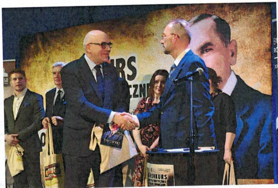
Fotografia 19. XI Konkurs Wiedzy Patriotycznej o Romanie Dmowskim; Patronat Honorowy Starosty Łomżyńskiego; 16 marca 2023 r., Białystok