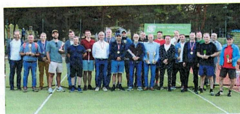
Fotografia 1. Powiatowe Zrzeszenie Ludowe Zespoły Sportowe w Łomży; Zakochanie XII sezonu Łomżyńskiej Ligi Tenisa Ziemnego; 24 września 2023 r., Łomża