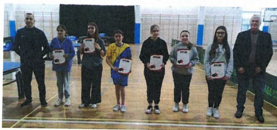
Fotografia 2. Powiatowy Szkolny Związek Sportowy w Łomży; Igrzyska powiatowe Dzieci w indywidualnym tenisie stołowym; 11 marca 2023 r., Nowogród