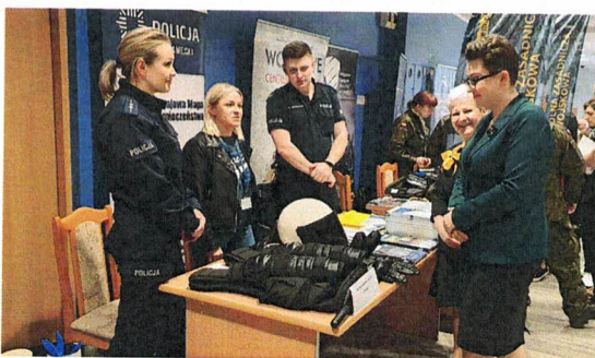
Fotografia 16. Targi Pracy Powiatowego Urzędu Pracy w Łomży; Patronat Honorowy Starosty Łomżyńskiego; 18 kwietnia 2023 r., Łomża