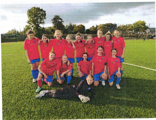
Fotografia 5. Gminny Klub Sportowy FORTY PIĄTNICA; Zespół Młodziczek podczas zawodów; 10 października 2023 r., Piątnica

Piątnicki GKS zrealizował założone zadanie poprzez prowadzenie treningów Seniorek, Tramperek i Młodziczek w wymiarze 1,5 godz. 3 razy w tygodniu oraz treningi Orliczek i Zaczków 2 razy w tygodniu po 1,5h. Działania podjęte przez Organizację miały na celu rozwijanie w punktualności, sumienności, upowszechnianie i rozwijanie rekreacji fizycznej wśród mieszkańców Powiatu Łomżyńskiego.