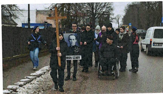
Fotografia 20. XXIX Ogólnopolski Złot Druha Szarego; Patronat Honorowy Starosty Łomżyńskiego; 11 marca 2023 r., Drozdowo